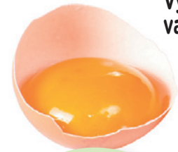
Vysoký obsah vajec