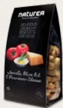
Rajče, olivový olej & parmezán