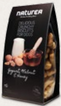
Jogurt, vlašské ořechy & med