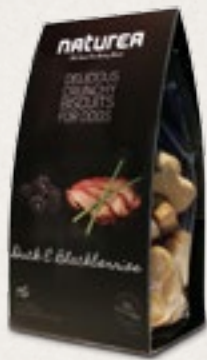
Kachna & ostružiny