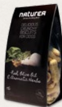
Ryby, olivový olej & bylinky