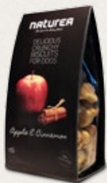
Jablko & skořice